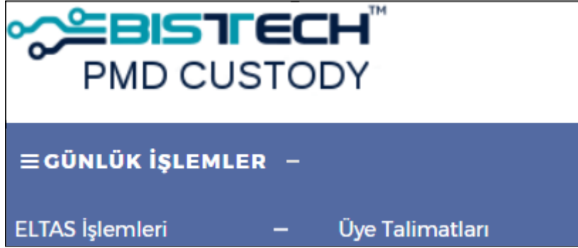
Şekil 3. Üye Talimatları Menüsü

KASA uygulamasına giriş yapıldıktan sonra “Günlük İşlemler”-> “ELTAS İşlemleri”-> “Üye Talimatları” adresiyle bildirim iletme ve takip ekranına girilir. (Şekil 3)