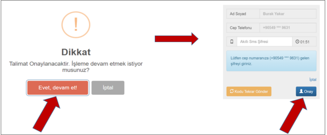
Şekil 8. SMS Onayı

Detay: Liste ekranındaki bu alanda “Açıklama” ve “İptal Nedeni” etiketiyle 2 farklı buton bulunabilir. Butonların detayları aşağıdaki gibidir: