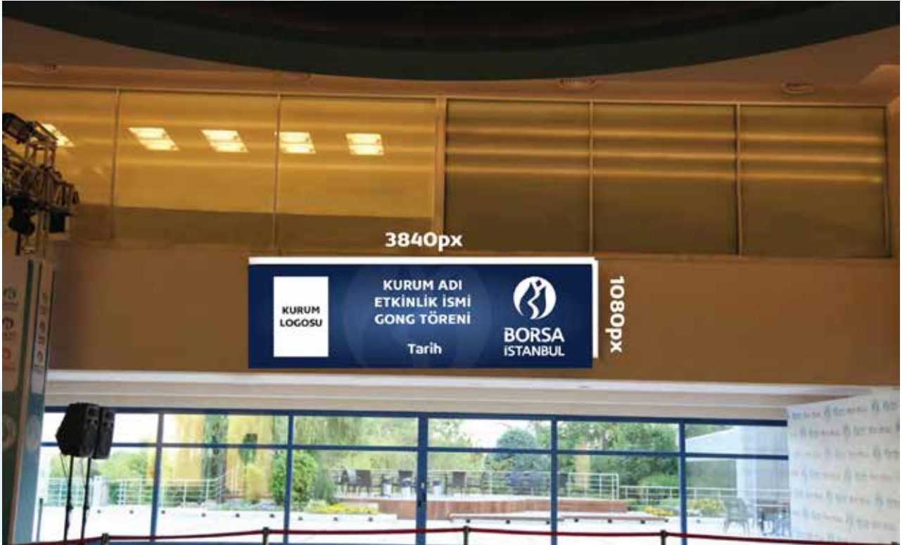
Yan Ekran Çerçeve Oranı (Aspect Ratio) 32x9