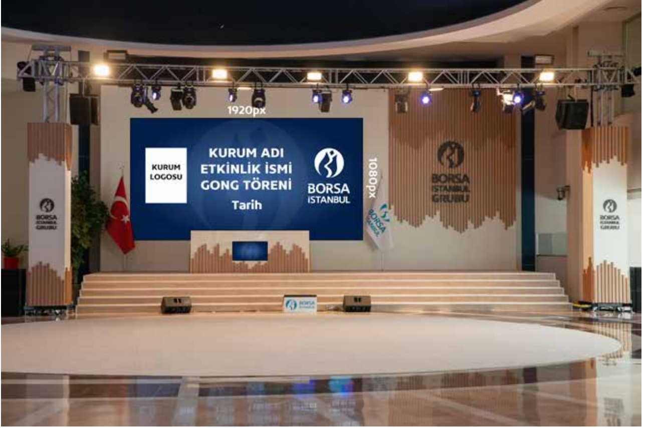
Ana Ekran Çerçeve Oranı (Aspect Ratio) 16x9