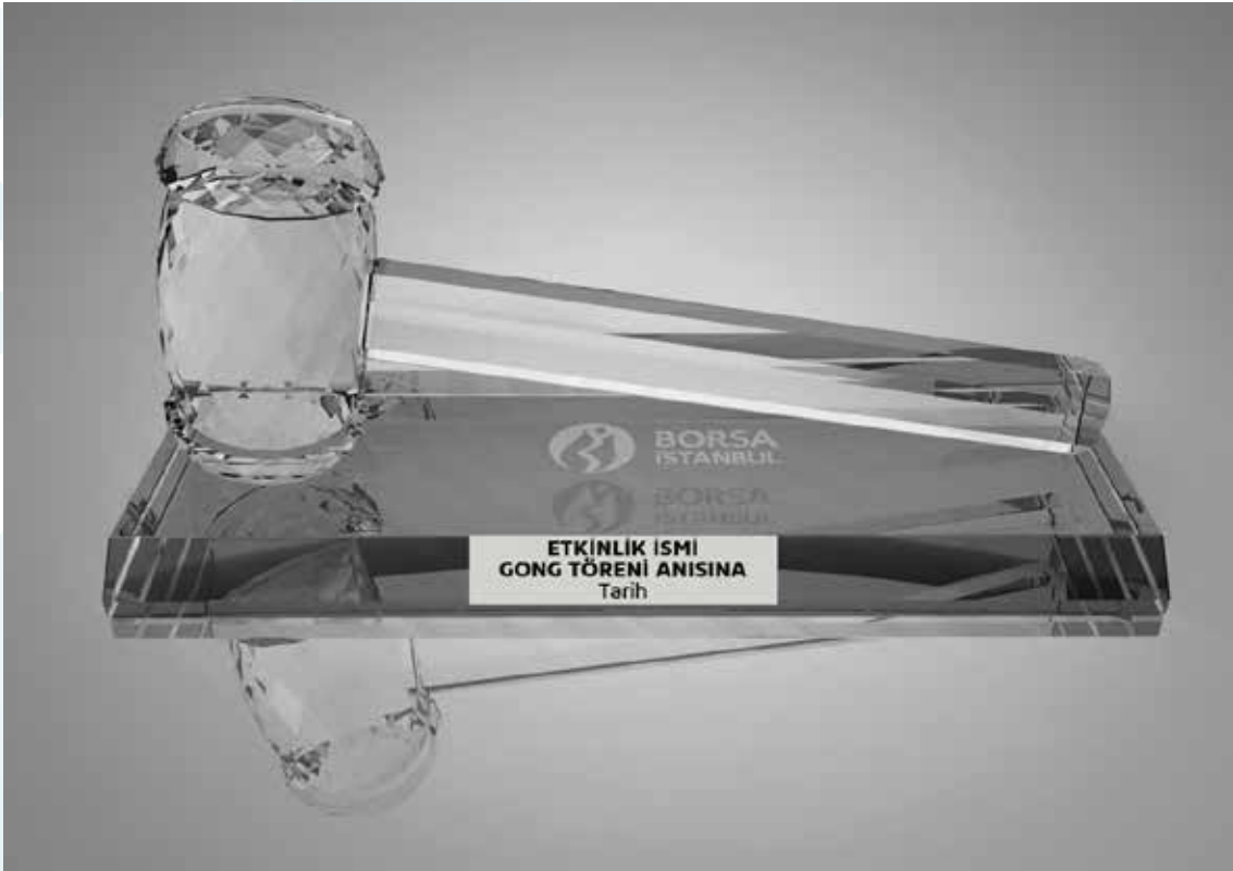
Hediye Kristal Tokmak